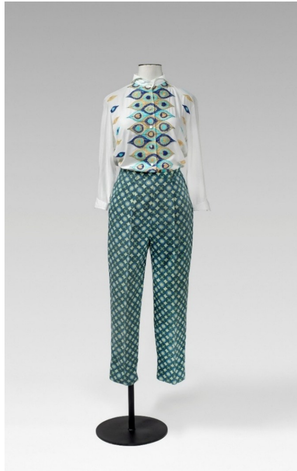
Oleg Cassini (Nova York). Brusa, c. 1958. White Stag (Portland). Pantalons, dècada de 1950