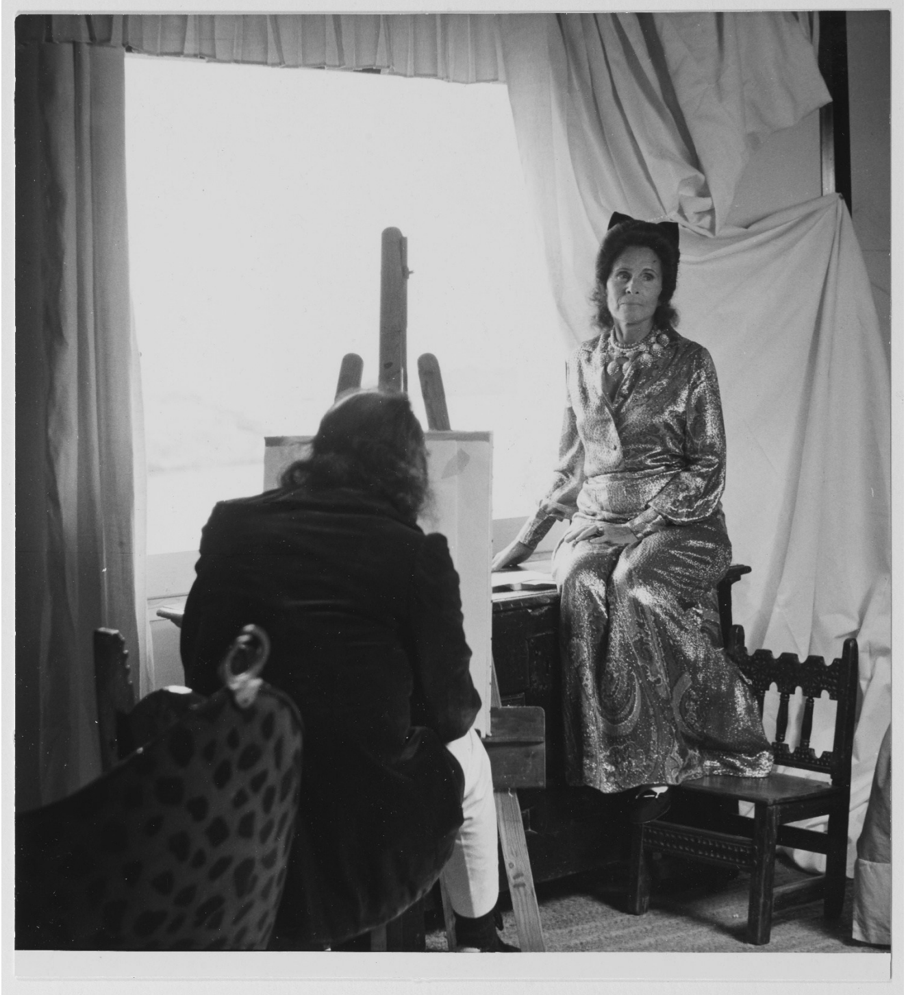
Salvador Dalí pintant Gala a Portlligat, c. 1971