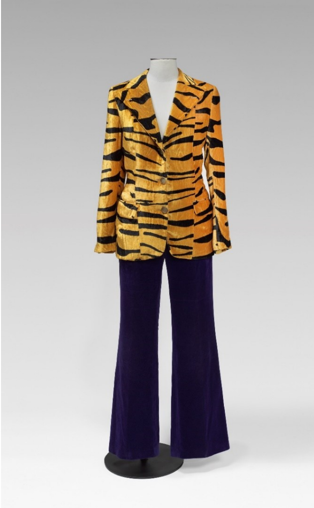
Maurice Renoma (París). Americana, dècada de 1970. Création Jean Couten (París). Pantalons, dècada de 1970