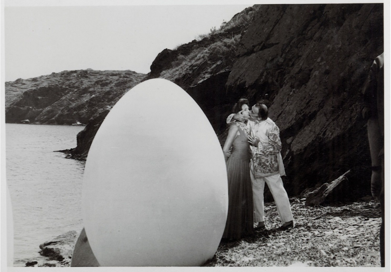
Gala i Salvador Dalí a Portlligat en el rodatge d'Autoportrait mou de Salvador Dalí, dirigit per Jean-Christophe Averty, 1966